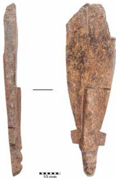
1. ábra. Zalavár-Vársziget, félkész agancs faragvány madár alakú szíjvégről.