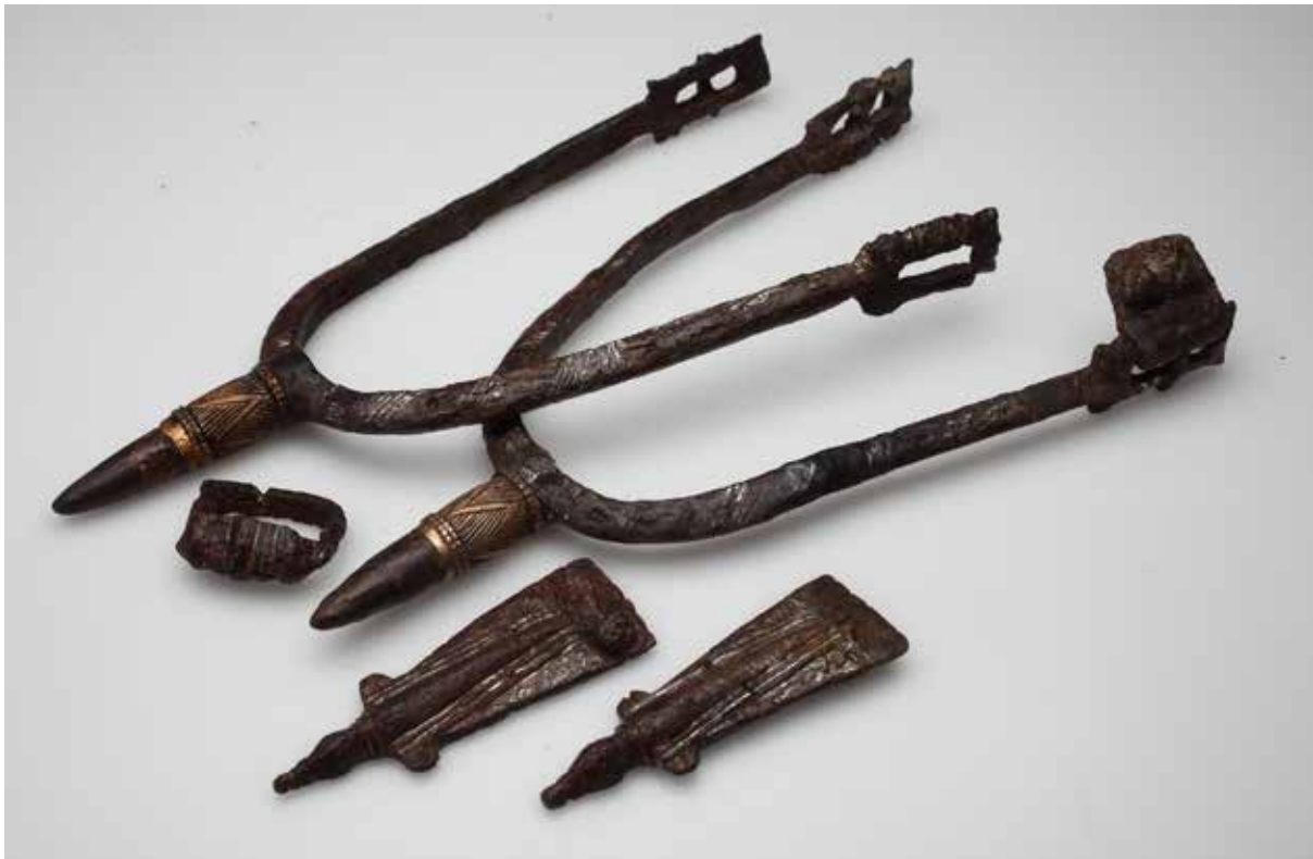
3. ábra. Zalavár-Vársziget, 269. sír, sarkantyúgarnitúra. Fig. 3. Zalavár-Vársziget, Grave 269, set of spurs.

Megtalálható ugyanakkor – bár jóval gyengébb minőségben és egyszerűbb kivitelben – Mosaburg vonzaskörzetében, egyes, a grófság szolgálatában álló közösségek vezetőinek sírjában is. Az egyik sarkantyúpár a Zalavár-Várszigettől északra fekvő Rezes vadászháznál feltárt temető teljesen feldúlt 1. sírjából került elő, amelyben feltehetően egy felnőtt férfi feküdt. 6 Mindkét sarkantyúnak hiányzott a tuskéje, ráadásul az egyik sarkantyú enyhén deformálódott is, de a sarkantyúk jó minőségű vasból készültek, és a nehéz variánshoz tartoztak. A felkötő szíjhoz tartozó szerelékből csak egy, a garnitúrához tartozó bábos díszű csat maradt meg, amit azonban a medence táján találtak, ezért feltehetően másodlagosan, övcsatként használták. 7 Ezzel szemben a könnyű variánst képviselte az a sarkantyúgarnitúra, ami Garabonc-Ófalu I. 70. sírjában, egy 46–55 éves férfi bokáinál viseleti helyzetben feküdt a felerősítő szíjazattal együtt. A jobboldali sarkantyú egyik szára a hosszú használat során eltörött és rézforrasszal javították meg. A felkötő szíj szerelékei is egyszerűbbek, a szíjvég sem madár alakú, hanem díszítetlen, nyújtott U alakú veret. 8