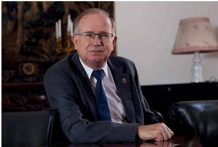
(© MTA, Szigeti Tamás)

“Abundant lines of the science itself Are different traits of one system only, They're charming together.” (Imre Madách: Tragedy of the Man , twelfth scene Translated from Hungarian by Ottó Tomschey)